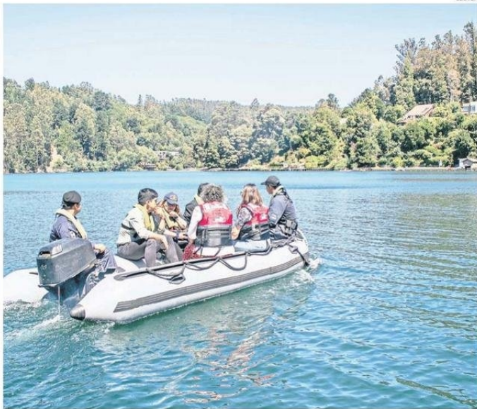
EN LOS PRÓXIMOS DÍAS, TAMBIÉN SE REALIZARÁ UNA FISCALIZACIÓN POR AGUA EN LA LAGUNA GRANDE

secuencias, ya que claramente la Delegación Presidencial puede dar la orden de demoler, y también podría haber multas de por medio, y porque además, si la gente quiere regularizar su muelle, también tiene que ser retroactivo, es decir, hay un pago de por medio del uso del espacio sin la debida autorización", sentenció.