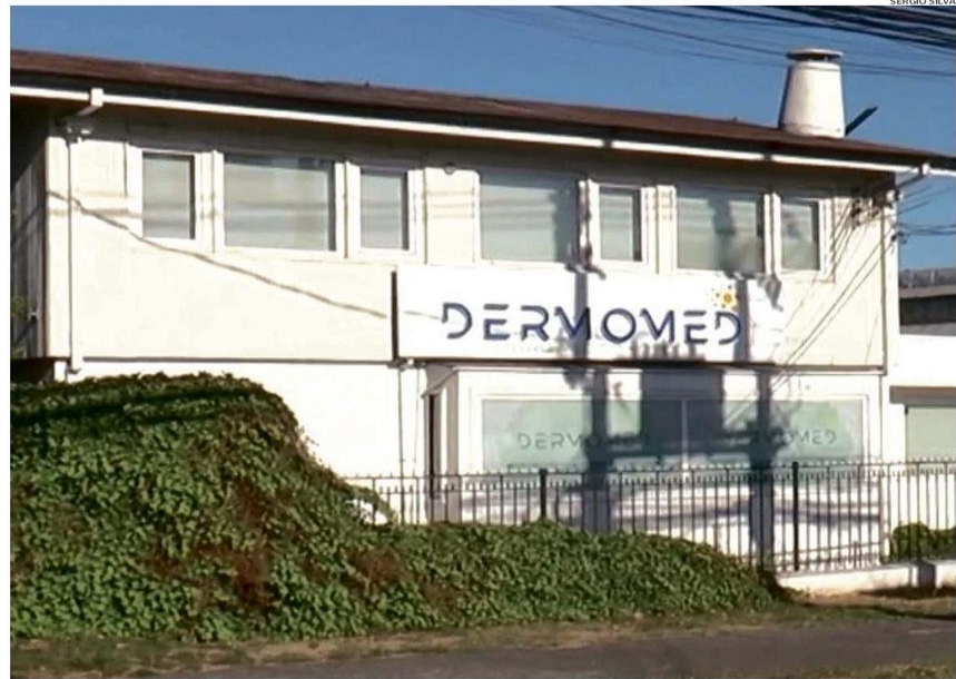
LA CLÍNICA SE UBICA EN CALLE FREIRE, AL LLEGAR A MANUEL RODRÍGUEZ. EL PERSONAL ADMINISTRATIVO Y OTROS PROFESIONALES RENUNCIARON.

La situación con la clínica y su representante se agudizó a poco días de haber iniciado el 2025, cuando un número importante de pacientes llegó a las instalaciones del Centro Médico y exigió la devolución de sus dineros. Esto generó que las propias funcionarias