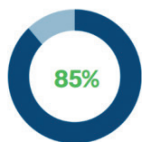
Ahorro en tiempo de preparación de carga