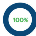
Trazabilidad de productos