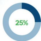
Ahorro en costos operacionales

Estamos en una etapa de consolidación en Chile, y potenciando nuestro proceso de expansión internacional tanto en Latam como en Europa. Nuestra filosofía y visión de futuro nos lleva a tener exploraciones y proyectos de I+D+i, los que nos han permitido estar siempre por delante de los modelos actuales, generando soluciones más integradas, visionarias y simples. En Tet4D democratizamos la tecnología avanzada, reducimos costos, optimizamos recursos y nos alineamos con la sostenibilidad ambiental, generando impacto económico y social. /NG Más información en www.tet4d.com