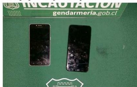
LOS EQUIPOS CELULARES QUE IBAN AL INTERIOR DEL TELEVISOR.

OPERATIVO. Mediante un escáner que revisa las encomiendas, se detectó que al interior del aparato se encontraban los equipos telefónicos y sus accesorios.