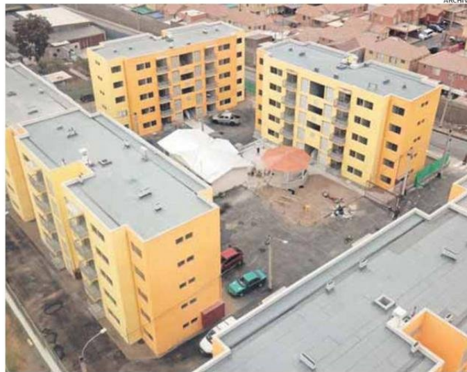
5.322 VIVIENDAS SE HAN ENTREGADO EN LA REGIÓN EN EL MARCO DEL PLAN DE EMERGENCIA HABITACIONAL.