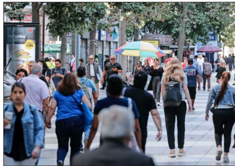
Sobre el alza de contratos indefinidos, la Encla señala que esta "puede interpretarse como un reflejo de dinámicas laborales que favorecen una mayor estabilidad".

ración o estabilización económica” pospandemia. En contraste, las modalidades de contrato a plazo fijo y por obra o faena representan el 14,1% y el 8,4% del total, respectiva-