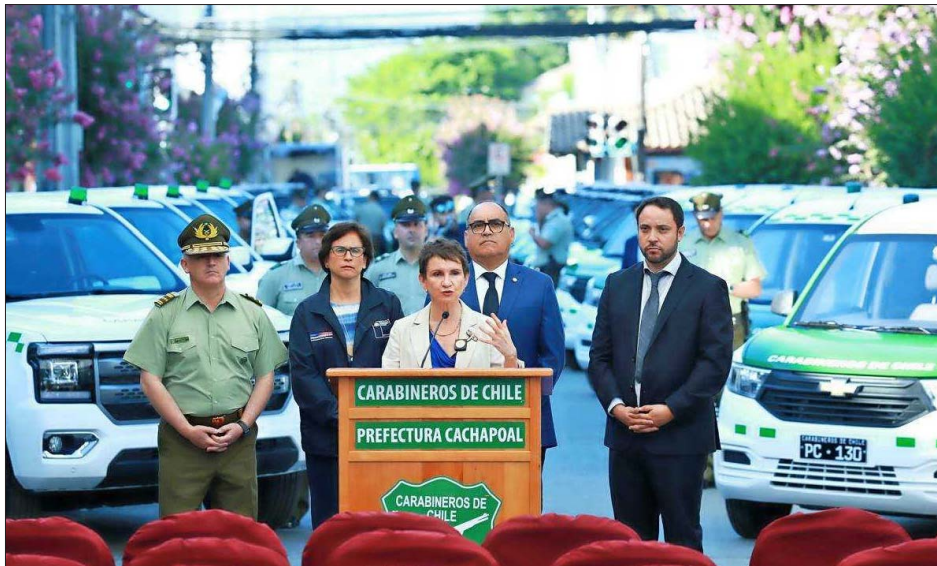
La titular de Interior, Carolina Tohá, entregó nuevos vehículos a Carabineros de San Vicente de Tagua Tagua ayer, un día después de que se hiciera público que el recorte presupuestario de su ministerio implicó una rebaja en el de la policía uniformada de más de $2.400 millones.

La jefa de gabinete, Carolina Tohá, atribuyó la disminución a un efecto "rebote"; al ser reducida la Partida de su repartición, se disminuyó a otros programas. Interior no habría sido informado del ajuste de Hacienda.