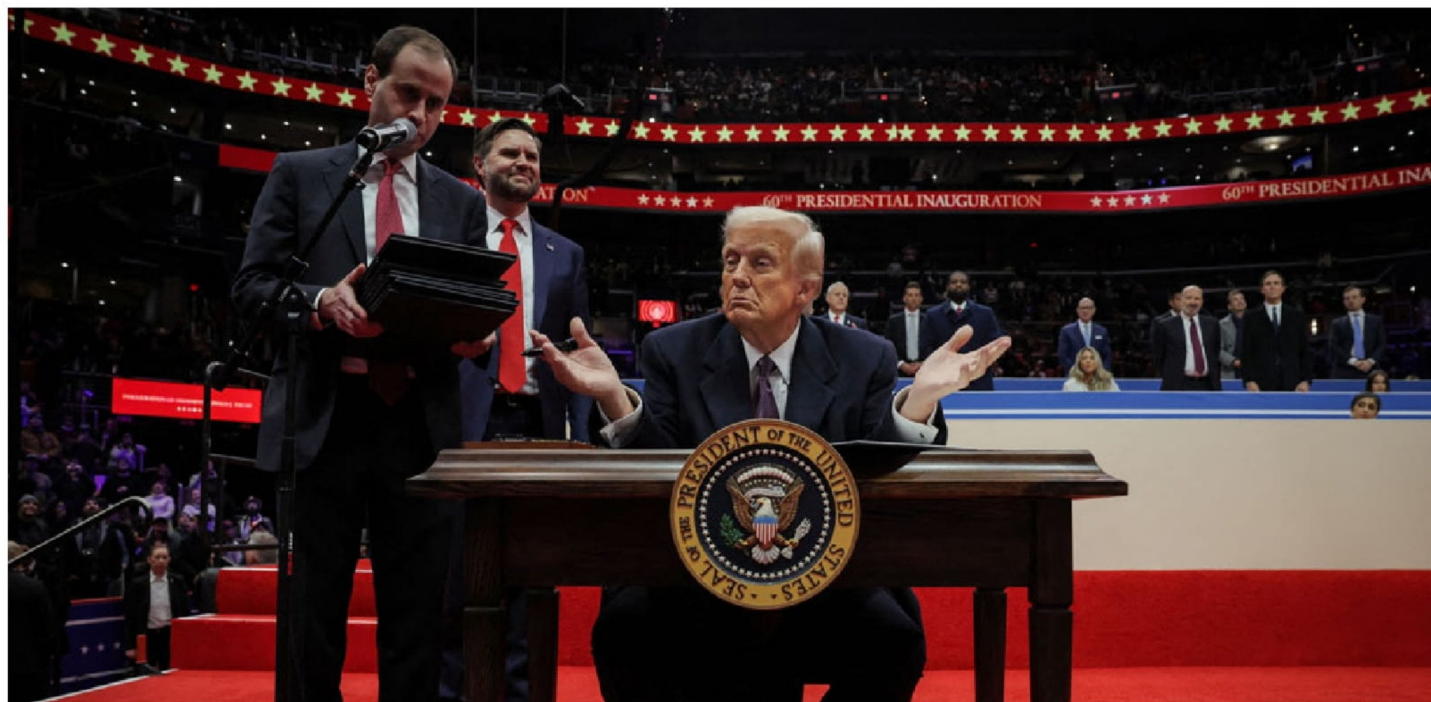
► El republicano Donald Trump, Presidente número 47 de Estados Unidos, sigue atento a la situación de Venezuela.

El enviado presidencial para misiones especiales, Richard Grenell, anunció que mantuvo conversaciones con agentes del régimen de Nicolás Maduro el lunes. Donald Trump, sin embargo, advirtió que “probablemente” EE.UU. dejará de comprarle petróleo a Venezuela.