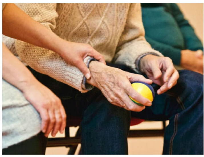
► El país deberá enfrentar desafíos como el impacto en el sistema de salud y pensiones.

El investigador de CIPEM, explica que esta diferencia se debe a una menor mortalidad en mujeres, condicionada por factores fisiológicos, socioculturales y conductuales. “Los factores genéticos, los estilos de vida más saludables y una mayor prevención influyen