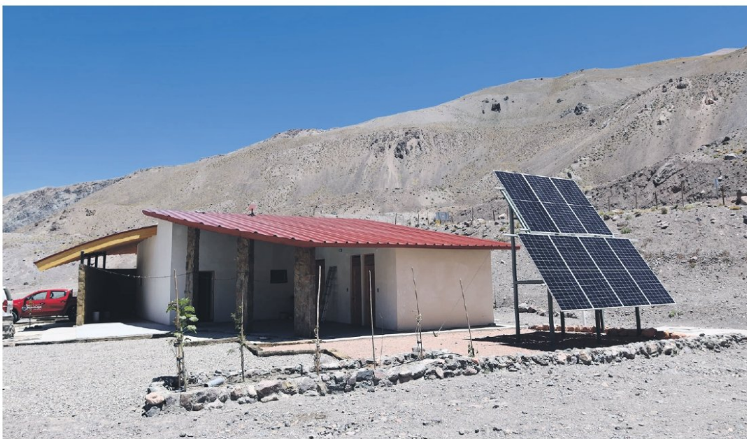
Imagen del nuevo módulo que ya está a disposición de los viajeros que transiten por el paso internacional.