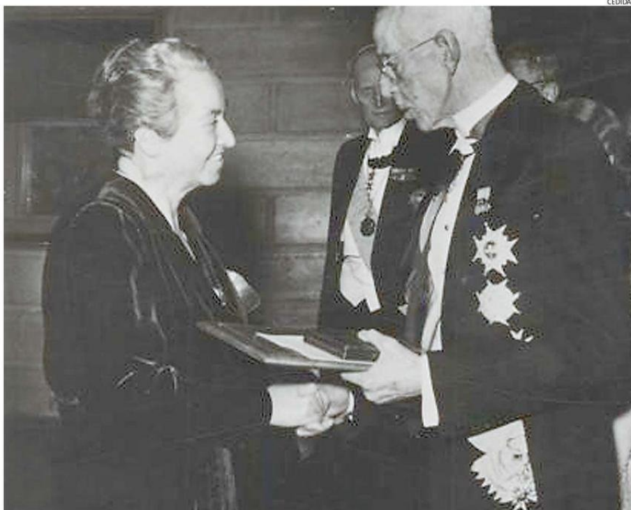
GABRIELA MISTRAL, RECIBE EL PREMIO NOBEL DE LITERATURA, POR EL REY GUSTAVO V DE SUECIA.

de diciembre de 1945 Gabriela Mistral recibió el premio Nobel de Literatura.