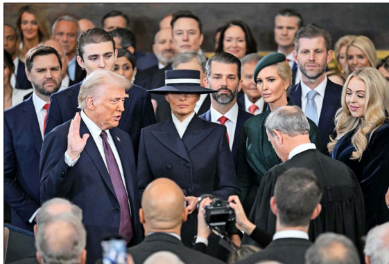
Luego de haber jurado "proteger la Constitución" sobre una Biblia heredada de su madre, bajo la cúpula del Capitolio, el 47º Presidente de Estados Unidos pronunció su primer discurso: delineó los ejes de su segunda administración, como la inmigración y la economía, además de anunciar que dará marcha atrás a diversas medidas de su antecesor, Joe Biden.

Declara "emergencia nacional" en la frontera con México, lo que le permitiría reforzar los controles con la presencia de militares.