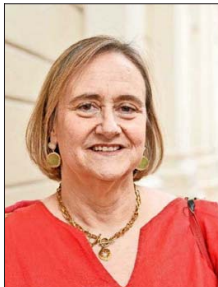
Leonor Etcheberry Court.