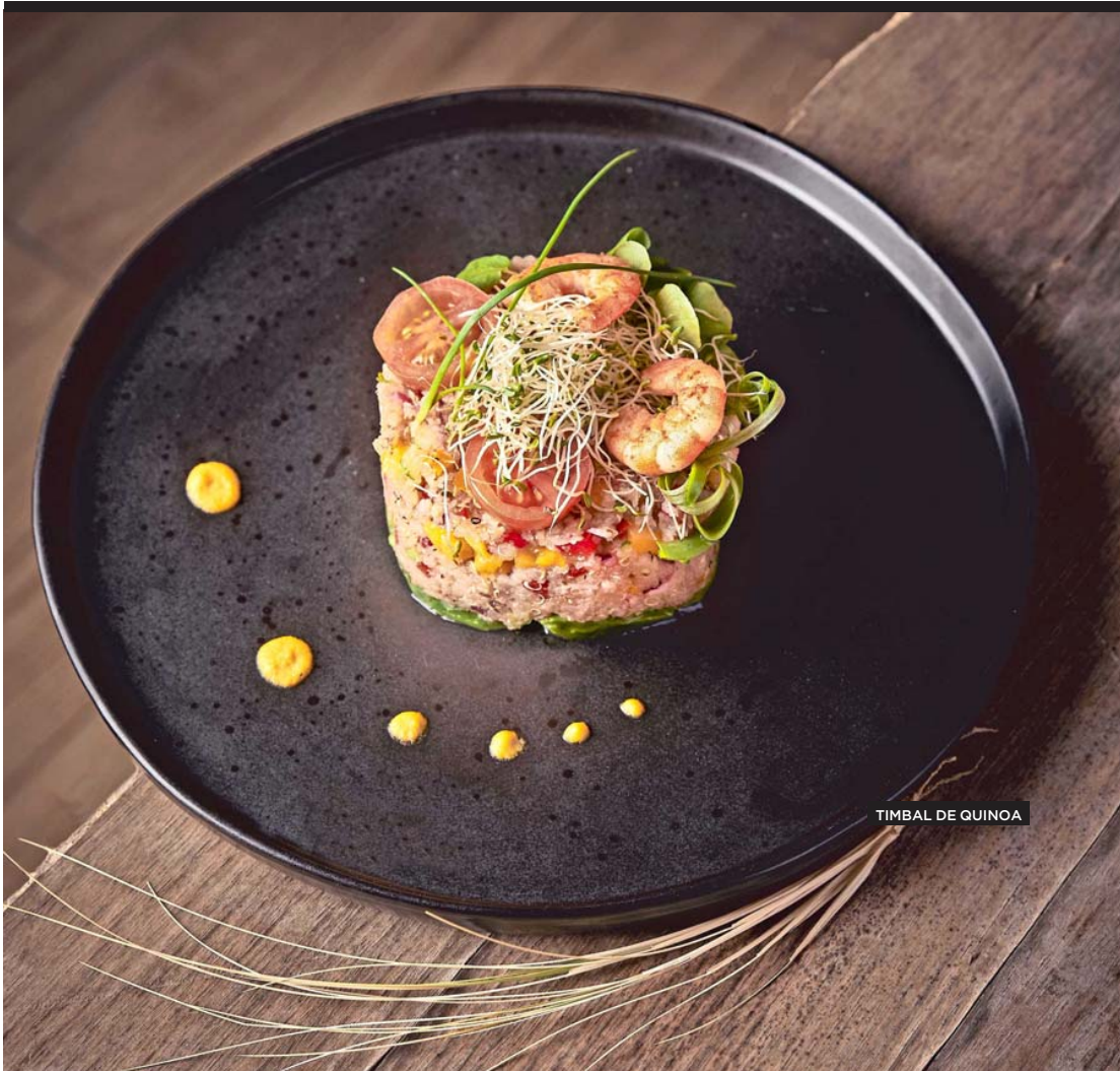
TIMBAL DE QUINOA