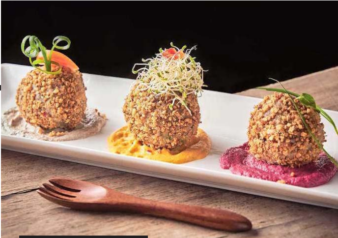
ALBÓNDIGAS DE PAPAS CHUÑO