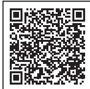
Aquí más información de diariotalca.cl