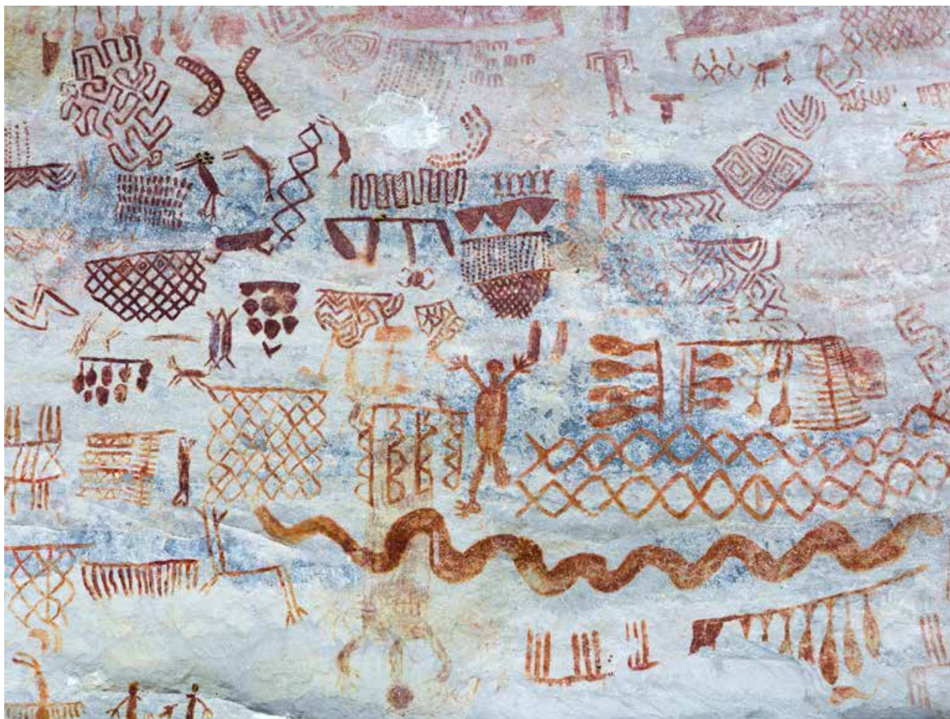
Pintura Rupestre en el Parque Nacional Chiribiquete, San José del Guaviare, Colombia.

Sagrada de Caral –tan antigua como Egipto–, hasta los cronistas de Indias y el mestizo Inca Garcilaso, pasando por el delirante milenarista Lacunza, o el otro jesuita, el botánico abate Molina, o tantos escritores como Alejo Carpentier, Violeta Parra, o un Guimarães Rosa. Ellos producen visiones, asegura, que permiten ver la morfología de la sociedad, como lo hace Roberto Matta. El reto sería no trancar esa rueda, dejar que sigan apareciendo propuestas innovadoras que recojan todo este legado porque, dice, recordando una frase propia de su libro «La Panamericana»: “América todavía no ha sido descubierta”.