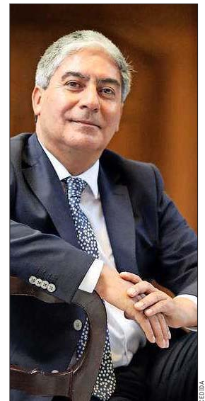
Diputado Henry Leal (UDI), asegura que envió oficios y solicitó fiscalizaciones para conocer la situación de las listas de espera en La Araucanía.

—Primero, queremos que nos diga qué ha hecho, cuáles son los éxitos que ha tenido, por qué llegamos a esto y lo más importante es que nos diga cómo lo va a resolver (...), cómo vamos a llegar a las cifras pre pandemia. Y también cómo se hace cargo de los compromisos de su Gobierno.