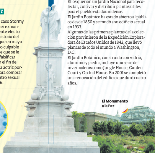
El Monumento a la Paz

El Jardín Botánico, construido con vidrio, aluminio y piedra, incluye una serie de invernaderos como Jungle House, Garden Court y Orchid House. En 2001 se completó una renovación del edificio que duró cuatro años.