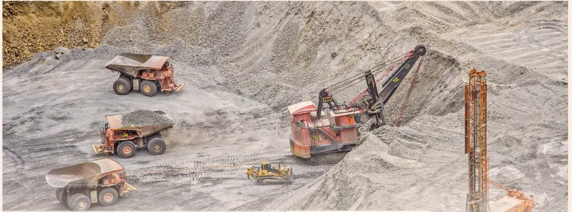
Las mayores transacciones cupríferas 2013-2024