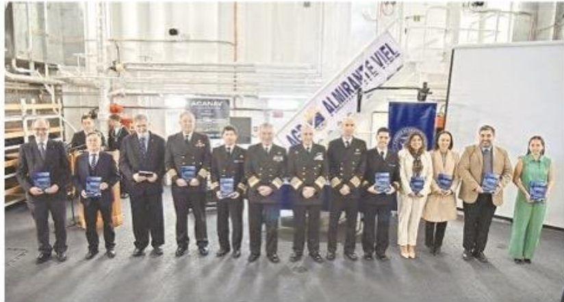
A bordo del nuevo rompehielos Almirante Viel se realizó, en septiembre pasado, el lanzamiento del libro "Territorio Chileno Antártico: una mirada multidisciplinaria". La actividad fue presidida por el comandante en jefe de la Armada de Chile, almirante Juan Andrés De La Maza, y contó con la presencia de miembros del Alto Mando Naval e invitados especiales.

La obra es contundente, sin embargo podemos decir que el conversatorio es una proyección mucho mayor, en donde los tomadores de decisiones, planificadores y ejecutores de acciones en el Territorio Chileno Antártico estaban juntos, siendo consultados por diversas temáticas, tanto desde la importancia de las ideas y conceptos, como la gene-