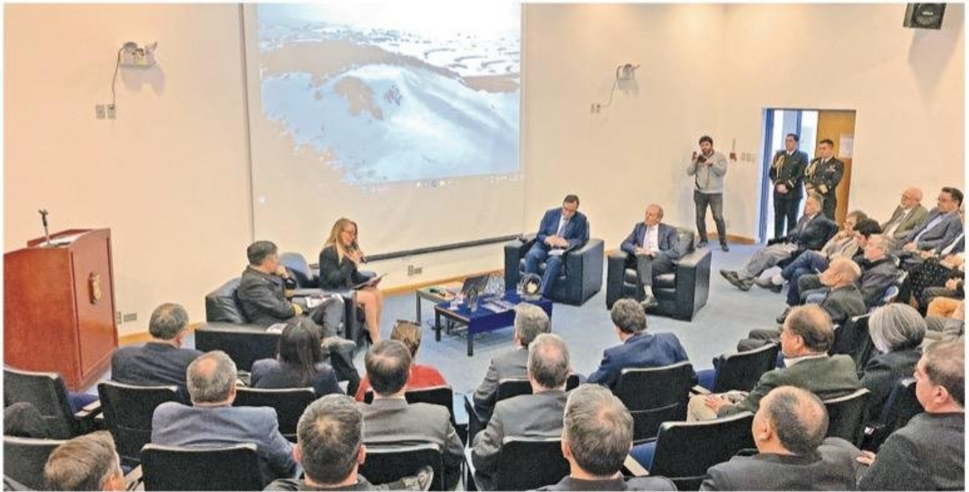
Un aspecto de la presentación del libro "Territorio Chileno Antártico: una mirada multidisciplinaria", en el Hospital de las Fuerzas Armadas de Punta Arenas.

REFLEXIONES DEL "TRIDENTE ANTÁRTICO" DE MAGALLANES