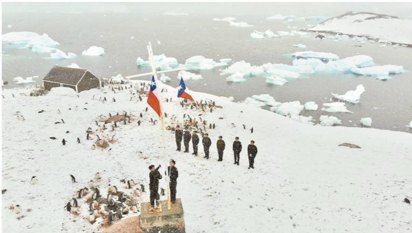
Luego de la construcción de la primera base chilena en 1947, diferentes instituciones decidieron acrecentar la presencia de Chile en la Antártica. Es así que hoy el país mantiene bases y refugios en diferentes lugares de su territorio antártico.