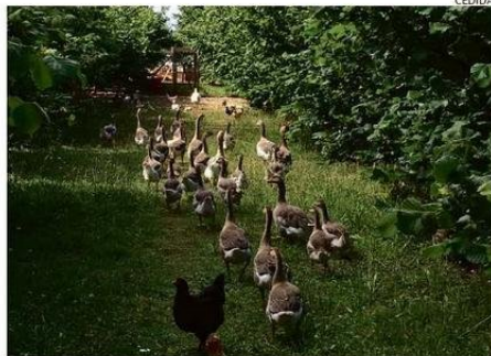
EN EL RINCÓN DE ARTURITO LAS AVES SON PARTE DE LA GRANJA.

"Todo lo que hemos construido aquí ha sido transportado en embarcaciones. Contamos con tinajas, espacios con duchas termosolares, un pequeño negocio de abarrotes, una zona de cabañas, arriendo de kayaks, paseos en lancha y, lo más importante, todo esto sin alterar la naturaleza viva de esta zona. Las personas que nos visitan buscan desconectarse de la agitada vida de las grandes urbes, y aquí encuentran esa paz. Este lugar es una bendición, algo que fue forjado principalmente por mis abuelos, especialmente mi abuela, quien falleció hace dos años a los 108 años. Su vida fue tan longeva porque era una mujer trabajadora, bondadosa y vivió rodeada de naturaleza toda su vida. Con su generosidad, qui-