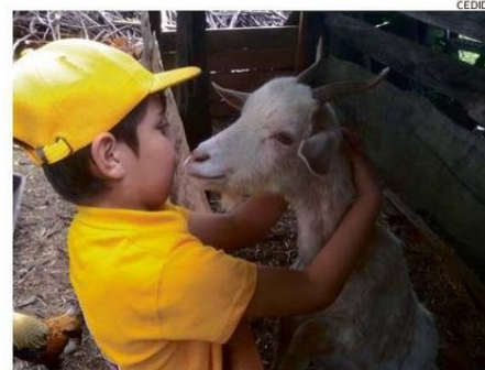
EN LA GRANJA EL RINCÓN DE ARTURITO HAY VARIEDAD DE ANIMALES.