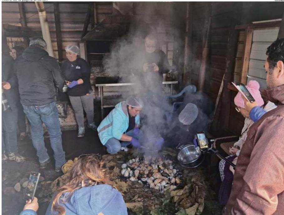
UNA DE LAS OPCIONES QUE OFRECE EL TURISMO RURAL ES DISFRUTAR DE COMIDAS TÍPICAS, COMO EL CURANTO AL HOYO.