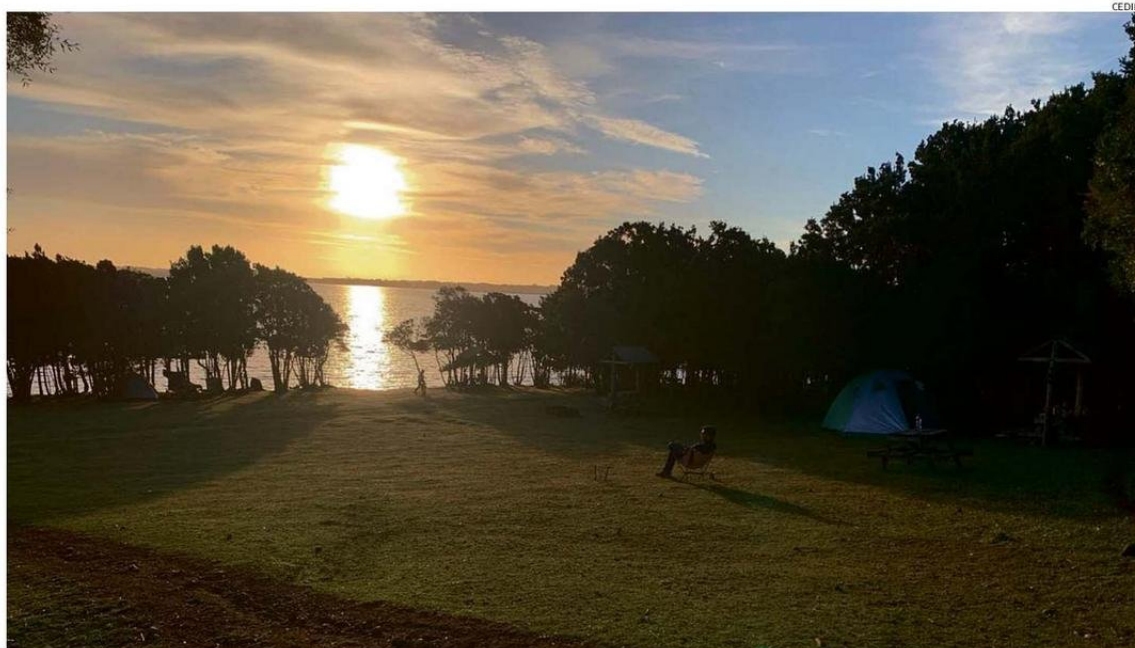
EN CUCAO ESTÁ EL CAMPING LA ABUELA, QUE COMENZÓ A OPERAR EN 1982, PERO QUE ASÍ ESTÁ EN LA ACTUALIDAD GRACIAS AL TESÓN DE SUS DUEÑOS.

A través de la experiencia de quienes lideran estos em-