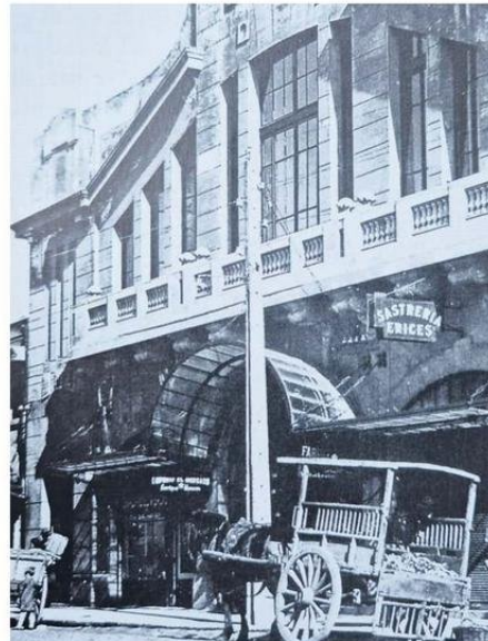
LA RECOVA Y EL MERCADO MODELO FUERON PUNTALES EN TEMUCO.