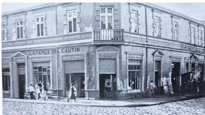
LOS GRANDES EMPORIOS O TIENDAS SURTIERON LAS NECESIDADES DE LA POBLACIÓN LOCAL.