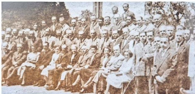
AÑO 1950. LA CÁMARA DE COMERCIO DE TEMUCO CELEBRA ENTONCES SUS PRIMEROS 25 AÑOS.