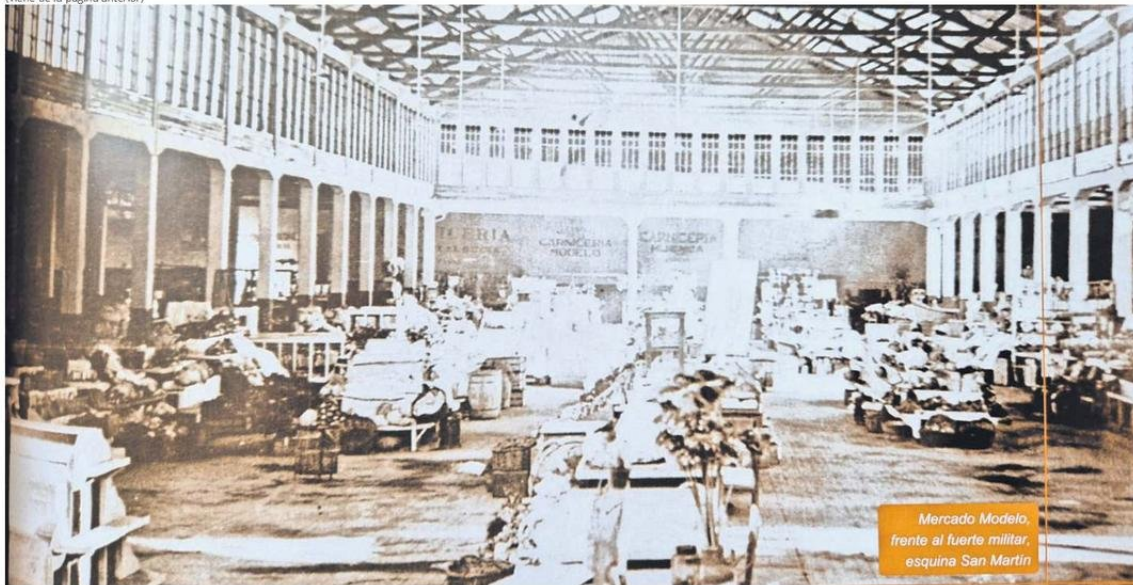
EN LA MEMORIA PUBLICADA PARA LOS 80 AÑOS DE LA CÁMARA DESTACA ESTA FOTOGRAFÍA HISTÓRICA DEL MERCADO MODELO DE TEMUCO.