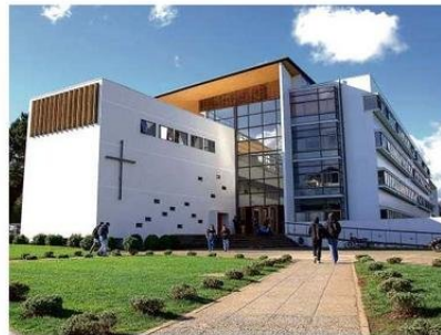
En más de 27615 metros cuadrados construidos, el campus San Juan Pablo II aloja 4 facultades.