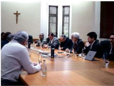
La Mesa Interempresarial es una iniciativa regional liderada por la Universidad Católica de Temuco.

En este ámbito, la Universidad cuenta con una carrera de Pedagogía en Lengua y Cultura Mapuche; un Centro de Documentación y Enseñanza de la Lengua Mapuche; un Núcleo de Investigación en Estudios Interétnicos e Interculturales; un