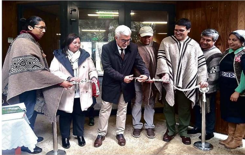
Con la presencia de autoridades universitarias y ancestrales del territorio se inauguró el Centro de Documentación, Enseñanza y Aprendizaje de la Lengua Mapuche, Kimeltuwpem.

Dicho compromiso fundacional trazó el camino de la casa de estudios, que en la actualidad representa un eje central de su misión en cada uno de los espacios de la universidad, como un puente que conecta el acceso a la educación con el desarrollo integral de la región, propósito que trasciende entre cada uno de los integrantes de la comunidad universitaria.