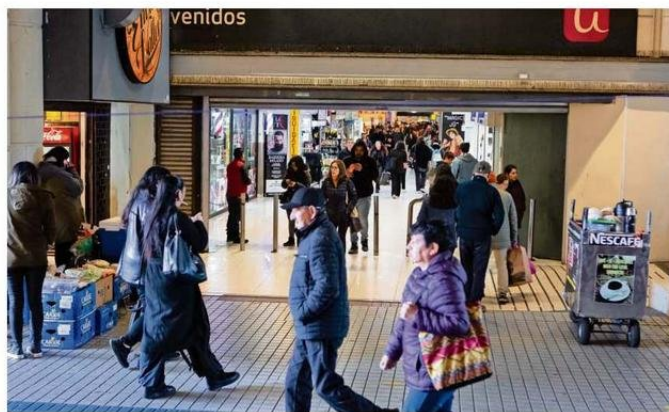
LA LLEGADA DE TURISTAS GENERA UN IMPACTO EN LA ECONOMÍA LOCAL, APUNTAN DESDE DIVERSOS SECTORES.

El coordinador de Turismo también atribuyó este fenómeno a diversos factores económicos y sociales, exponiendo que "creemos que el tipo de cambio, las liberaciones y estímulos de la actividad económica en Argentina y el desarrollo de nuestra industria local como un polo de desarrollo, explican este flujo significativo y el aumento que es percibido en nuestra ciudad durante los últimos meses. Ello está beneficiando a las grandes tiendas y a los comercios menores de Puerto Montt, dando un fuerte impulso a la actividad económica local".