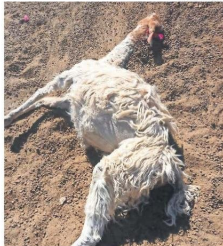
LOS POBLADORES QUIEREN APOYO DE LAS AUTORIDADES.

dan desarrollar las medidas necesarias para proteger sus ganados.