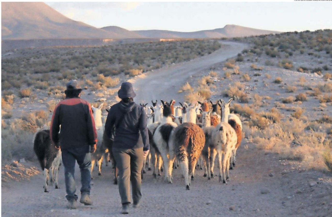
VAN 45 MUERTES DE LLAMAS, PRODUCTO DE LOS ATAQUES DE LOS PUMAS, REGISTRA LA COMUNIDAD DE CASPANA.