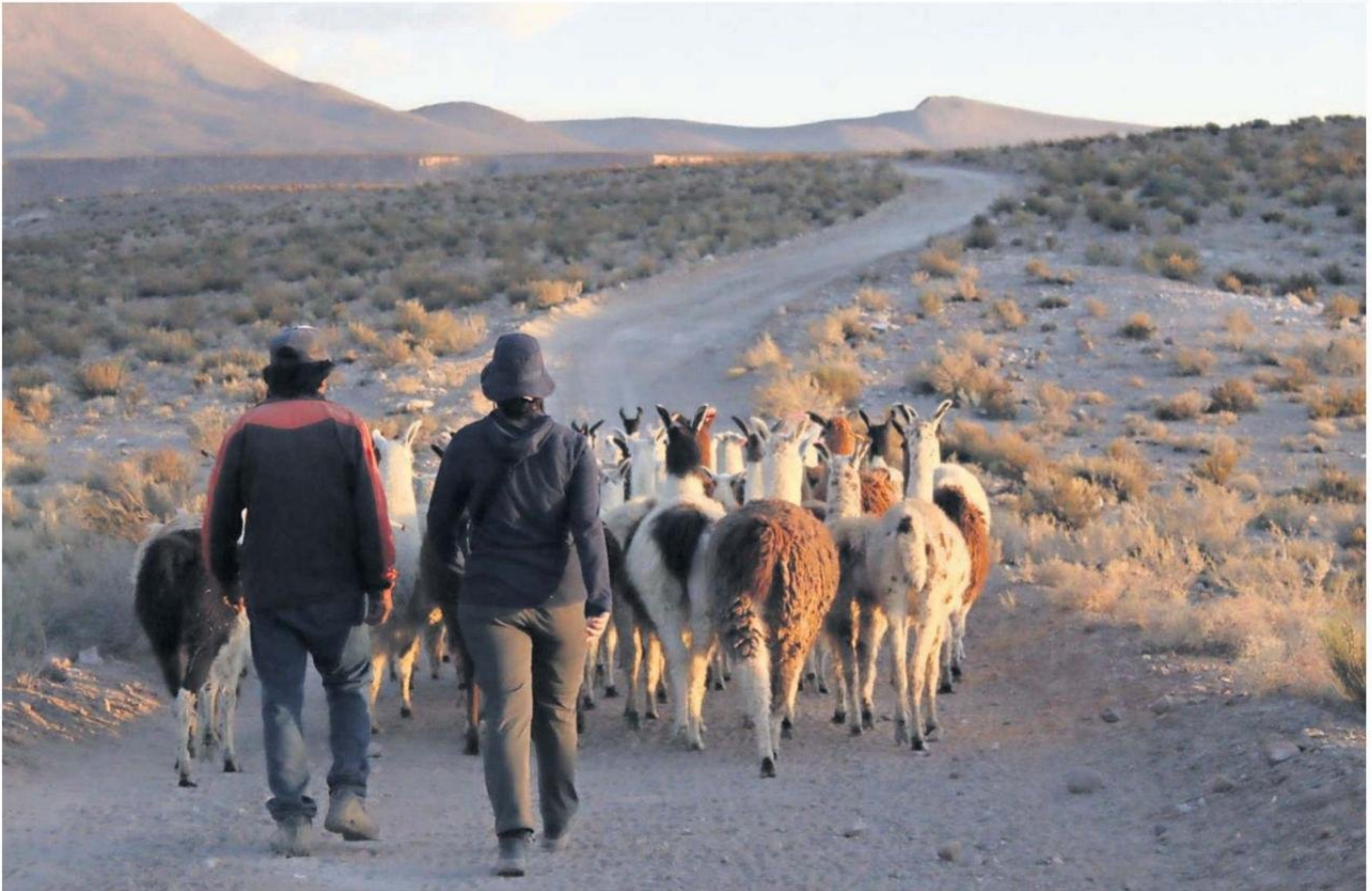
VAN 45 MUERTES DE LLAMAS, PRODUCTO DE LOS ATAQUES DE LOS PUMAS, REGISTRA LA COMUNIDAD DE CASPANA.