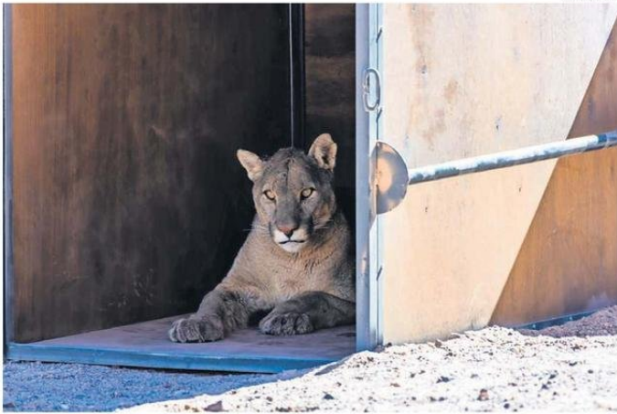
EN ALGUNOS CASOS, EL SAG CAPTURA A LOS PUMAS Y LOS LIBERA EN SECTORES ALEJADOS.

En Caspana existen actualmente cerca de 80 familias que trabajan en ganadería y agricultura. Según cifras propias, entre 2021 y 2024 han ocurrido 45 muertes de llamas por ataques de pumas, además de 19 corderos y 2 cabritos que han sido lastimados por el felino.