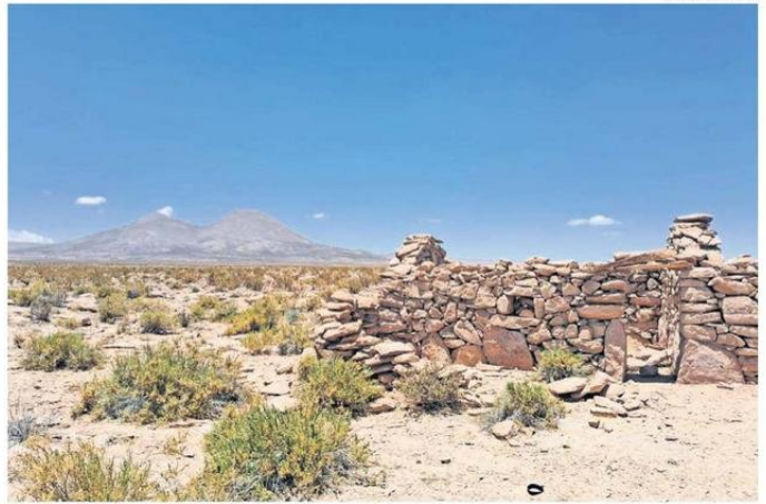
CASPANA ES UNO DE LOS POBLADOS AFECTADOS POR LOS ATAQUES DE LOS PUMAS.

“Nosotros venimos con estos ataques desde hace ya harto tiempo, solo que ahora se volvieron más masivos y ya hace casi dos años son ataques masivos. Sobre el poblado de Caspana, somos aproximadamente 48 ganaderos en mi comunidad, muy a menor escala. Sin embargo, por lo menos un 15 por ciento de nuestros ganaderos han sufrido ataques del puma en corral o cerco, que es lo que a nosotros más nos llama la atención. Si bien es cierto sabemos que el puma es un animal que ha sido parte de nuestro entorno paisajístico, llamémoslo así, siempre habíamos sabido convivir con él, él vivía en grandes alturas. Incluso teníamos sectorizados los espacios donde ellos habitaban, entonces para nosotros el puma nunca fue un tema del pueblo en sí. A partir de hace dos años el puma empezó a bajar, donde pue-