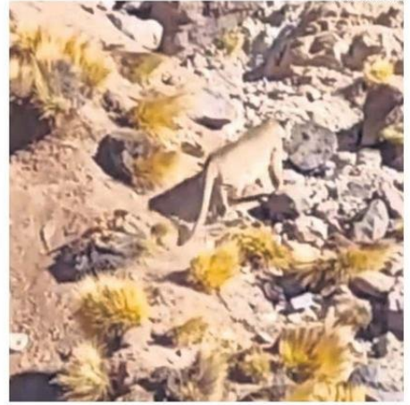
ESTA SEMANA FUE AVISTADO EN PUMA EN SAN PEDRO.

Asimismo, la dirigente indicó que sería ideal que, cuando el SAG capture a un puma y lo libere en otro punto de la zona, poder conocer donde estaría para así ellos mismos pue-