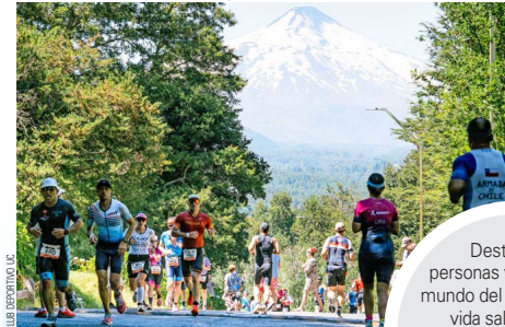
Este fue el primer Ironman de Pucón carbono neutral, gracias a la alianza estratégica con Colbún.