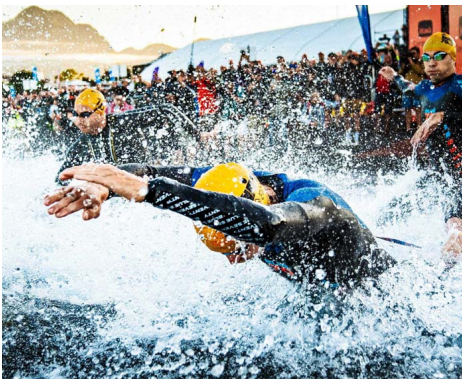
Colbún neutralizará el evento con bonos de carbono provenientes de su central hidroeléctrica Quillico.