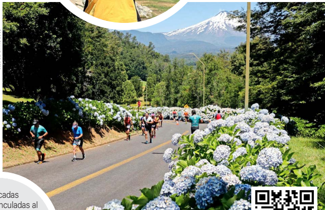
Colbún espera neutralizar alrededor de 500 toneladas de dióxido de carbono.