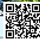
Más información sobre los bonos de carbono.

Destacadas personas vinculadas al mundo del deporte y a la vida saludable se sumaron a la campaña “Ironman 70.3 Pucón 2025, carbono neutral by Colbún”.