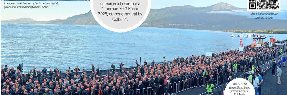
Más de 3.000 competidores fueron parte del Ironman 70.3 Pucón.

Destacadas personas vinculadas al mundo del deporte y a la vida saludable se sumaron a la campaña “Ironman 70.3 Pucón 2025, carbono neutral by Colbún”.