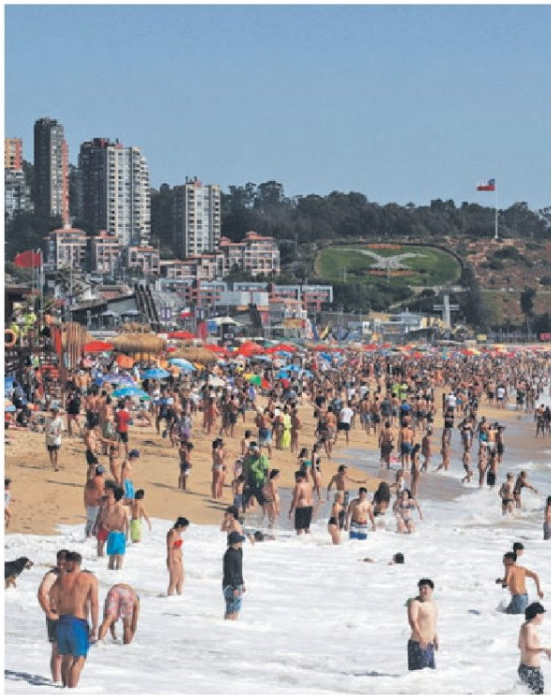
► Viña del Mar es la comuna con más visitantes.

Imágenes como esta son las que autoridades locales y del gobierno buscan evitar, y para lograr