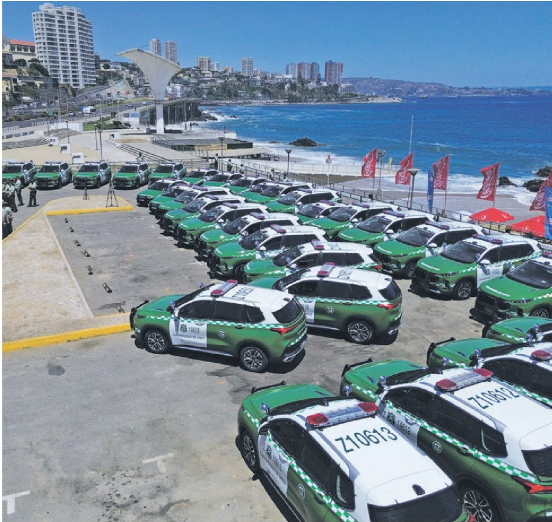
► La Región de Valparaíso tiene 60% más carabineros que el año pasado en el verano.

está en el decomiso del comercio ilegal de alcohol y alimentos. Además de emplear elementos tecnológicos para el resguardo de las playas nortinas.