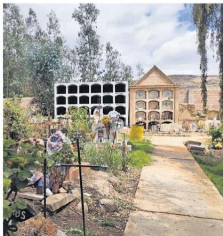
EL CEMENTERIO DE TARUCACHI TIENE MUCHOS ALE Y CALIZAYA PERO NINGUN PINOCHET NI UGARTE.