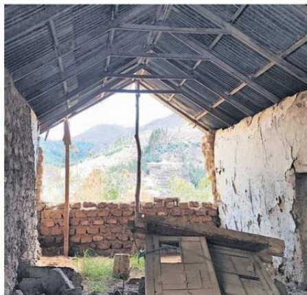
DESDE EL INTERIOR DE LA CASA, SOLO QUEDA ESTO EN PIE.