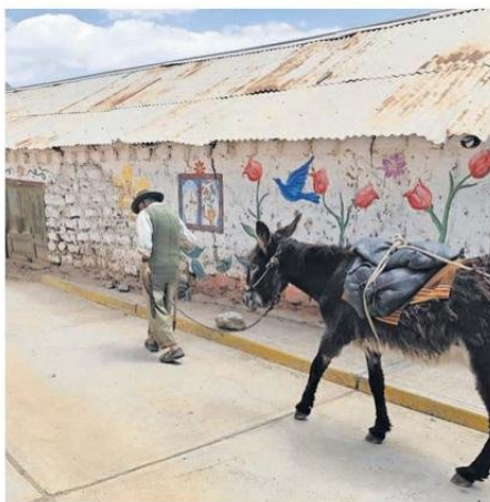
NO MÁS DE 200 PERSONAS VIVEN EN EL POBLADO, QUE TIENE COMO PRINCIPAL ACTIVIDAD LA AGRICULTURA Y GANADERÍA.