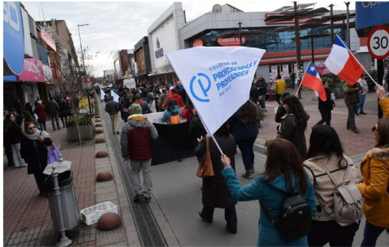
LOS DOCENTES DE BIOBÍO se han movilizado para exigir el pago de la "deuda histórica".

El proyecto, que no sufrió modificaciones en la Comisión de Educación, será discutido en la Comisión de Hacienda el próximo lunes, según adelantó el presidente del gremio. De aprobarse en esta instancia, la