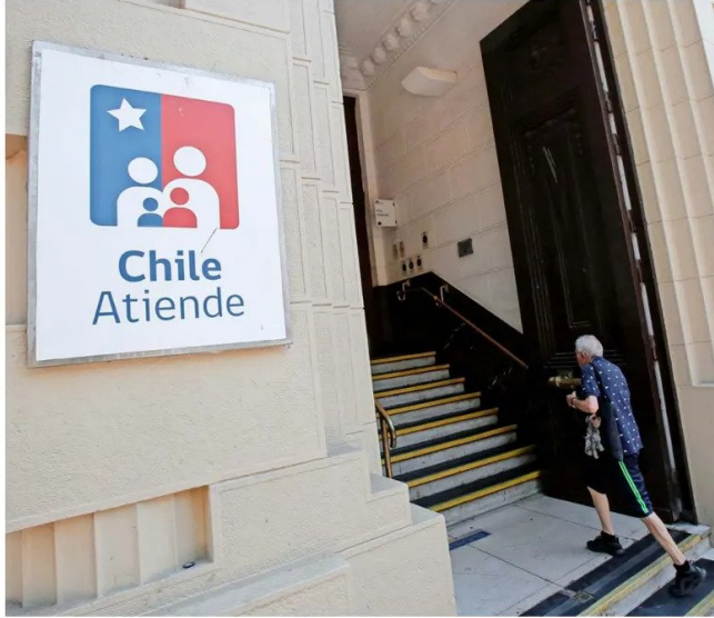
ChileAtiende, como la puerta de entrada a beneficios y servicios del Estado, es altamente valorado.