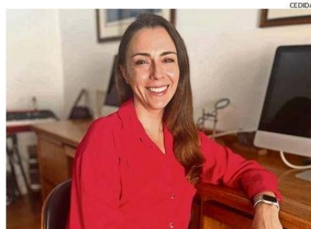
Churruca es una de las autoras y magister en neurociencias.

En esa línea, la especialista plantea que “a diferencia de otros métodos como la saliva, la orina o la sangre, el análisis de uñas permite evaluar el estrés acumulado durante un período prolongado. Esto lo convierte en una herramienta más fiable para en-