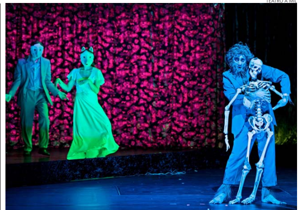
“Lapis Lazuli” solo tendrá tres funciones en el Teatro Municipal de Las Condes.

El griego relata que coincidió con Pina dos veces en su vida. Una de ellas como encargado de vestuario en un