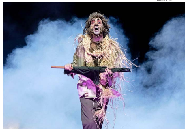
En escena, los artistas se mueven, emiten ruidos, intervienen luces, pero palabras no hay.

espectáculo en Nueva York. —Sé, por lo que escucho de ella y por mi conexión personal, que era una persona muy sensible hacia las historias universales de la perspectiva humana. Su legado sigue impactándonos —opina.