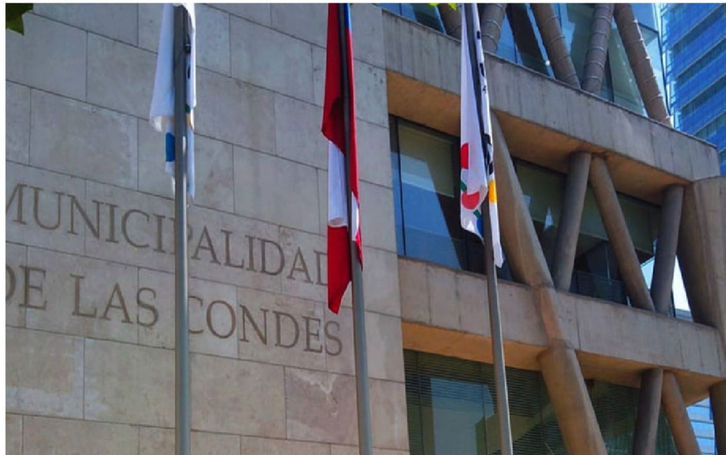
► Los juicios representan un riesgo financiero para la Municipalidad de Las Condes.

El organismo enfatizó que esta omisión representa un incumplimiento de la normativa vigente, la que "establece que se deberá reconocer una provisión cuando la municipalidad tenga una obligación presente