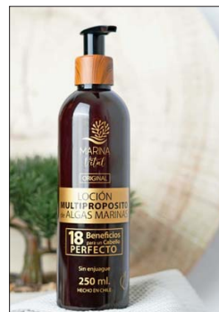
Loción multipropósito de algas marinas, el producto central de Marina Vital.

"Nuestros tratamientos no solo cumplen con altos estándares de calidad, sino que están pensados para las particularidades de nuestro entorno", explica.