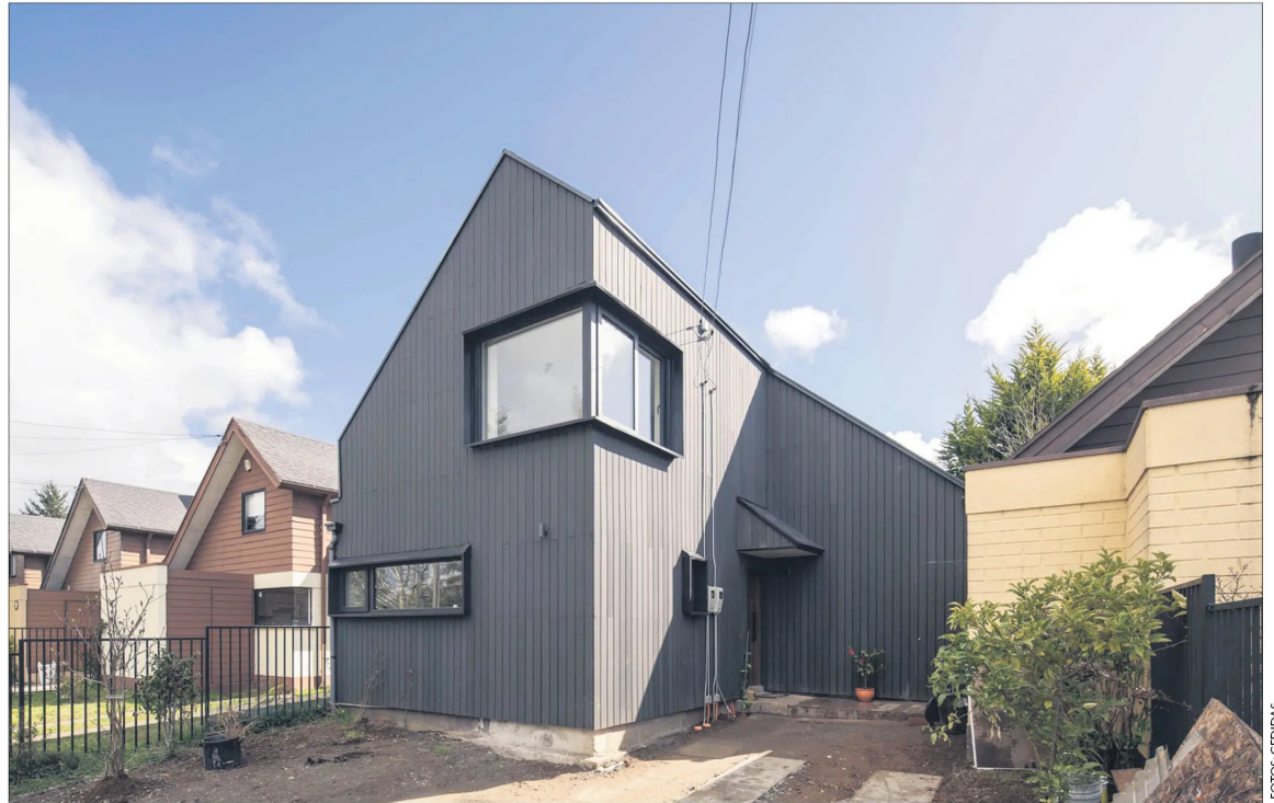
El Estudio Diagonal (@estudiodiagonal.arq en Instagram) le dio un look industrial a la casa, que contrasta con el ladrillo de las otras viviendas.

Arquitecto a cargo cuenta que los vecinos se acercaban a la obra a preguntar detalles: “Pudieron ver las potencialidades de sus casas”.