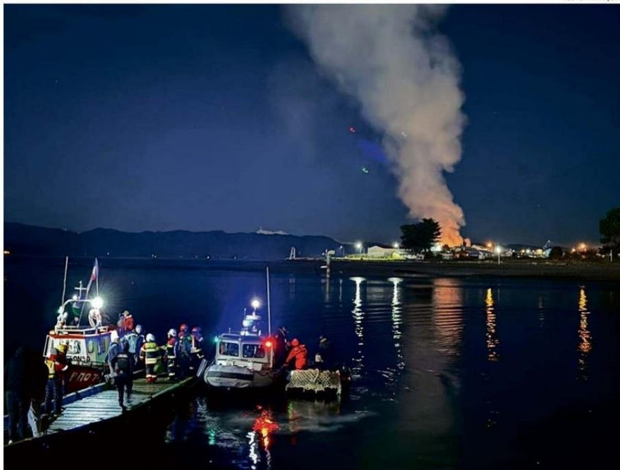
EL 21 DE JULIO DE 2024 SE PRODUJO UN INCENDIO EN EL SECTOR LA PUNTILLA DE ISLA TENGLÓ. TRES CASAS RESULTARON DESTRUIDAS Y DOS CON DAÑOS.