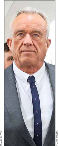
KENNEDY FUE CANDIDATO a la presidencia en 2024.

diencia en la que fue cuestionado por los demócratas.