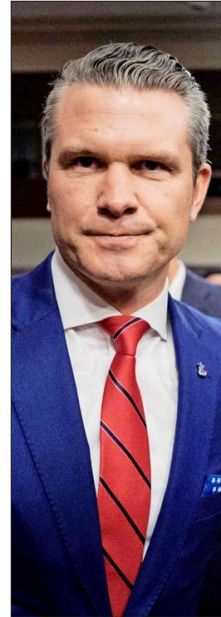
HEGSETH FUE interrogado ayer en el Senado.