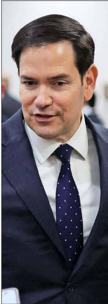
RUBIO ASESORA a Trump con respecto a América Latina.

“No soy una persona perfecta”, dijo ayer, pero desacreditó los informes sobre su mala conducta como parte de una “campaña de desprestigio coordinada” destinada a perjudicarlo a él y a Trump. También se describió a sí mismo como un “agente de cambio” que hará que el Pentágono responda mejor a las amenazas globales, en una tensa au-