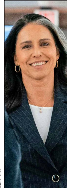
GABBARD ASPIRA a ser directora de Inteligencia Nacional.