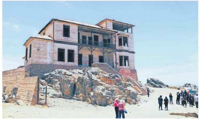
UNO DE LOS PASEOS DESARROLLADOS FUE EN LA LOCALIDAD DE GATICO.