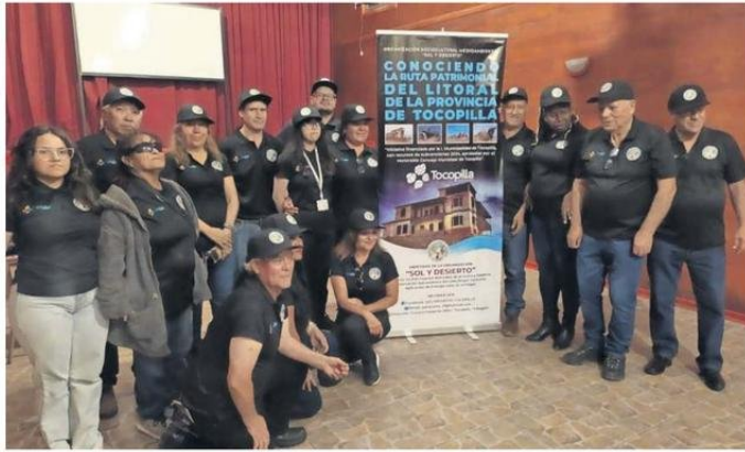
LOS INTEGRANTES DE LA AGRUPACIÓN SOL Y DESIERTO DE TOCOPILLA.