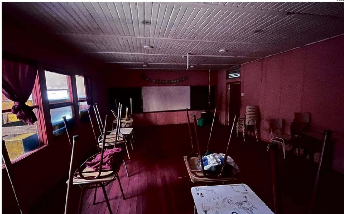
GOTERAS EN LOS TECHOS Y PAREDES DE SALAS DE CLASES, HAN DETERIORADO ESA INFRAESTRUCTURA DEL COLEGIO DE DIFUSIÓN ARTÍSTICA LOS ULMOS, EN LA COMUNA DE LOS MUERMOS.