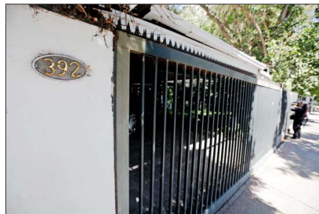
El inmueble cuya venta está en cuestión, ubicado en Providencia.

Asimismo, plantean que la explicación del Gobierno al "sostener que el contrato no está perfecto porque aún está pendiente una aprobación del contrato por parte de la Administración del Estado es desconocer los principios básicos del Derecho: el contrato solemne es perfecto como contrato civil y