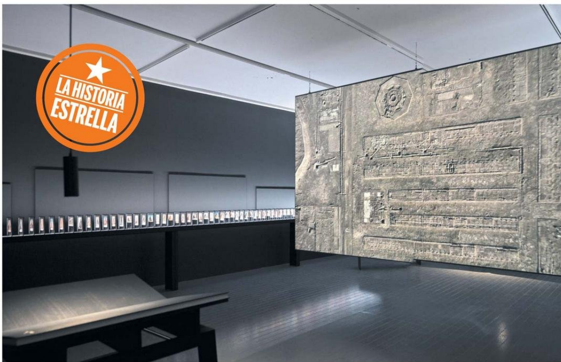
EXPOSICIÓN CHILEHAUS EN EL CENTRO CULTURAL LA MONEDA

A través de archivos, videos, fotografías, sonidos y postales recopiladas entre Alemania y Chile, esta muestra explora la relación entre el edificio Chilehaus y la industria del salitre instalada en el desierto de Atacama a principios del siglo XX.