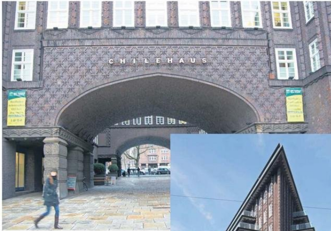
ENTRADA Y BELLEZA (ABAJO) DEL EDIFICIO CHILEHOUSE EN ALEMANIA.