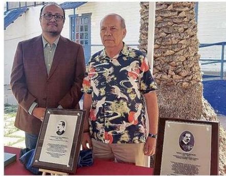
LAS PLACAS EN RECUERDO DE LOS FUNDADORES DE LA OBRA.