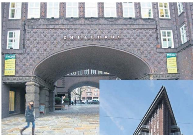
ENTRADA Y BELLEZA (ABAJO) DEL EDIFICIO CHILENOUSE EN ALEMANIA.