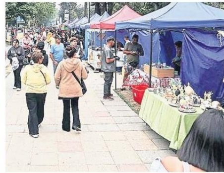
AMBULANTES FUERON UNA PREOCUPACIÓN EN LA FERIA DE 2024.