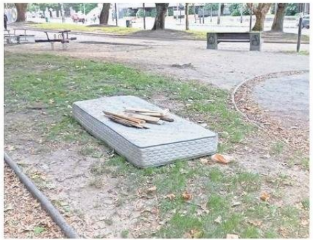
VECINOS ESPERAN MÁS CUIDADO CON LAS ÁREAS VERDES.

de un fin de semana, entonces se nos planteó una estrategia para abordar estos problemas y esperamos que se desarrolle de buena manera”, indicó la dirigente, añadiendo que “lo complejo es la basura que se genera por la cantidad de gente que llega y los automóviles mal estacionados”.