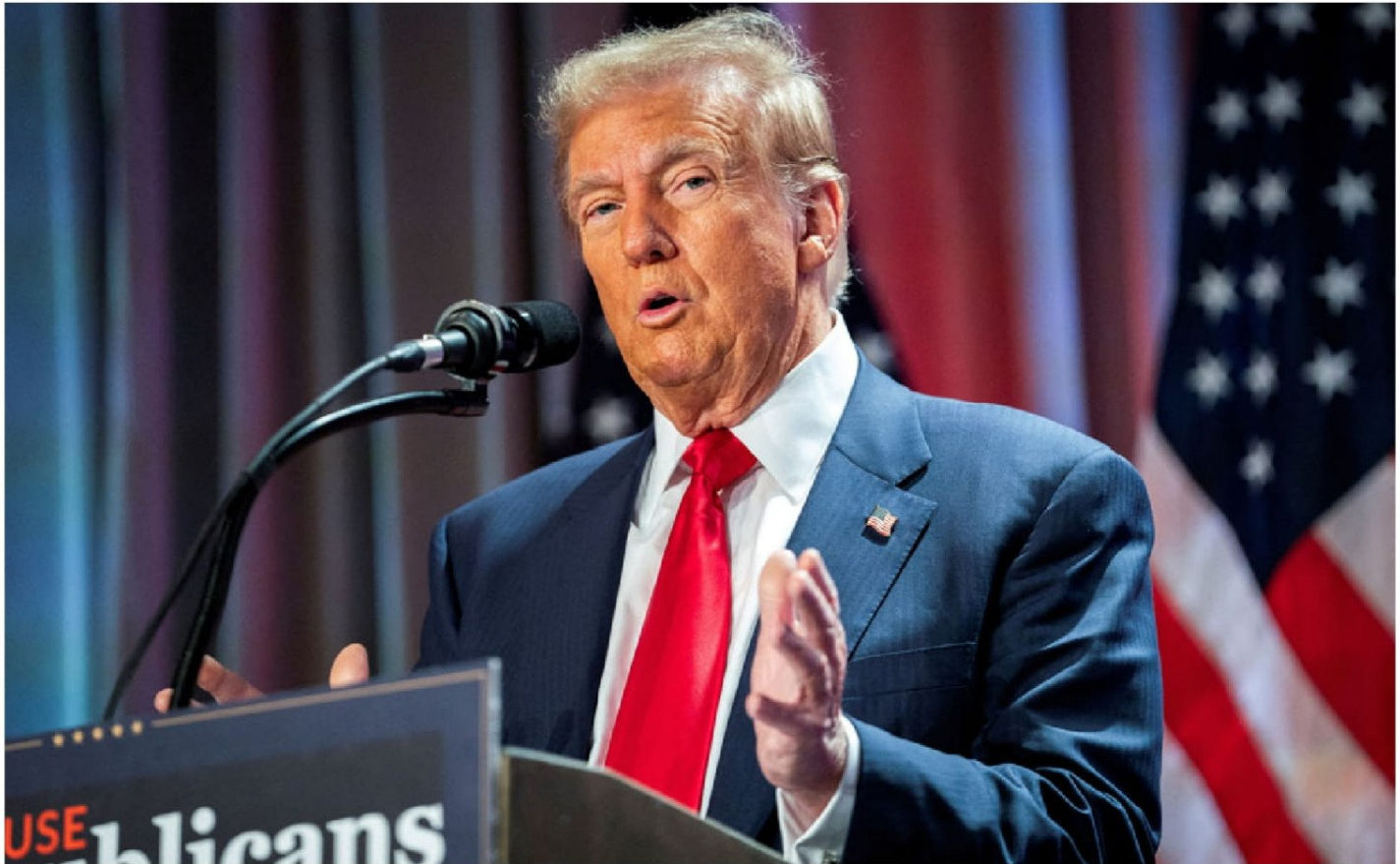
► El presidente electo de Estados Unidos, Donald Trump, en una reunión con los republicanos de la Cámara de Representantes en Washington, el 13 de noviembre de 2024.

Trump ha recaudado más de 170 millones de dólares para su próxima toma de posesión, una cantidad récord lograda por los aportes de ejecutivos de tecnología y los grandes donantes. Aún así, no existe claridad sobre qué artistas participarán en esta ocasión.