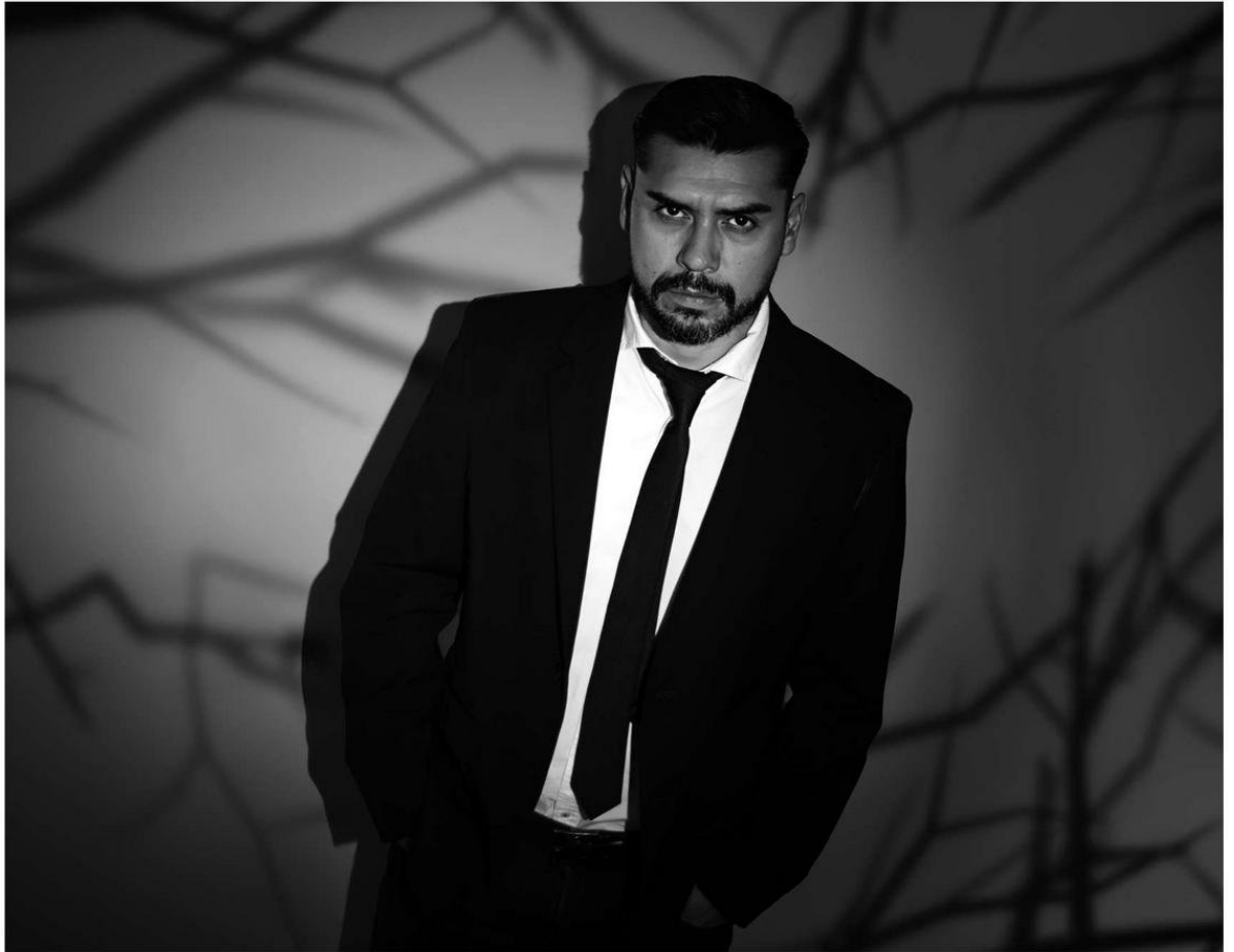
"Me demoro mucho en investigar, meses, incluso hasta un año estoy investigando para mis proyectos", dice el autor.

"Todos mis libros se basan en investigaciones. Yo no me demoro mucho en escribir, lo mío es la narrativa breve, me gusta como formata la nouvelle (narración entre el cuento y la novela), pero, si bien me demoro poco en escribir, me demoro mucho en investigar, meses, incluso hasta un año estoy investigando para mis proyectos", agrega el también autor de "Los que susurran bajo la tierra", cuya área "de investigación en la universidad es la estética del horror" y sus clases son de literatura creativa y oratoria. En estas últimas clases se mezclan estu-