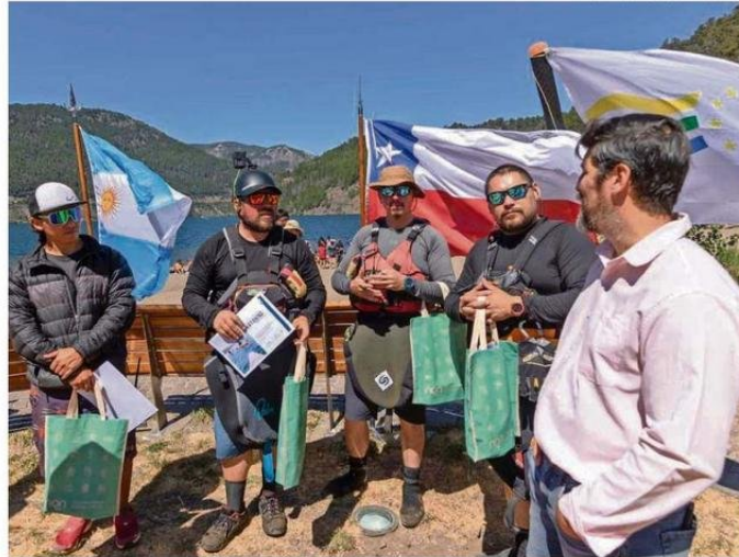
AUTORIDADES ARGENTINAS RECIBIERON A LOS DEPORTISTAS EN SAN MARTÍN DE LOS ANDES.

Según informaron los organizadores, la travesía se desarrolló con el lema "Aguas con Historia" y simbolizó "un paso más hacia la consolidación del corredor binacional como un espacio de cooperación, turismo sustentable y desarrollo econó-