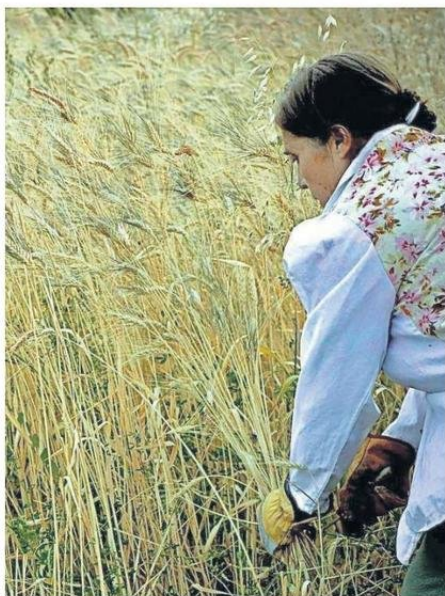
VARIEDADES DE TRIGO BARBA NEGRA, TRIGO CHOCO Y TRIGO BLANCO.