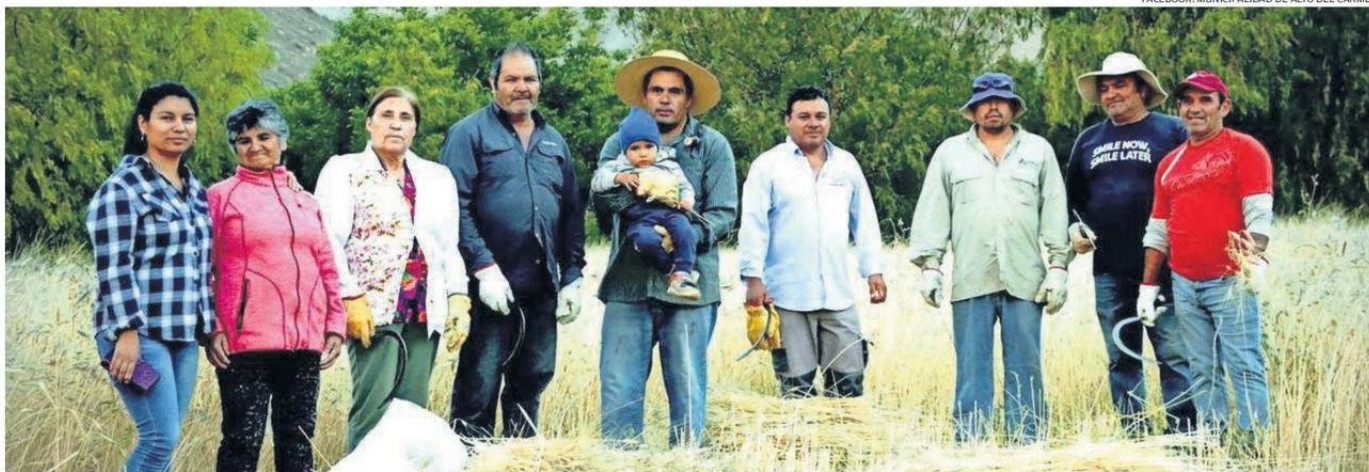
LA COMUNIDAD INDÍGENA DIAGUITA EL CORRAL DE LA ALTA CORDILLERA QUEBRADA POTRERILLOS Y SUS AFLUENTES SEMBRARON TRIGO DE MANERA COMUNITARIA PARA PRESERVAR RAÍCES.