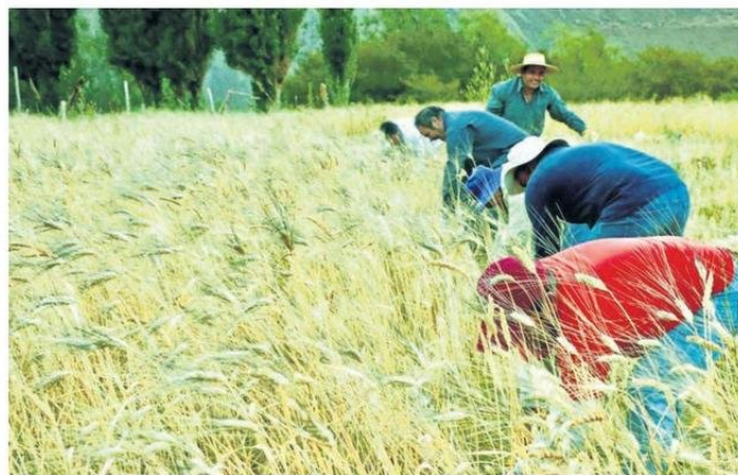
BUSCAN FORTALECER LAS PRÁCTICAS AGRÍCOLAS INDÍGENAS ASOCIATIVAS Y CAMPESINAS.