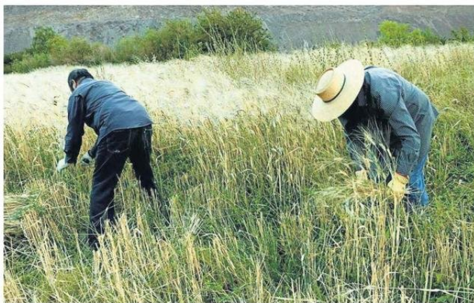
LA TRILLA COMUNITARIA SERÁ EL 7 Y 8 DE FEBRERO EN EL SECTOR DE EL CORRAL.